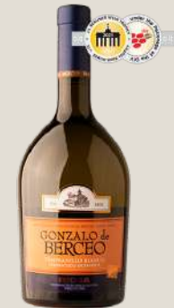
Gonzalo Berceo Tempranillo Blanco