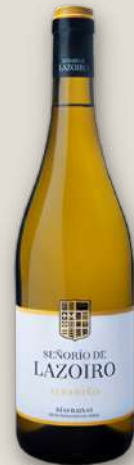
Albariño señorío de lazoiro