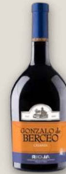
Gonzalo de Berceo crianza