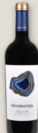
Guadianeja Tempranillo Alto Hungrao