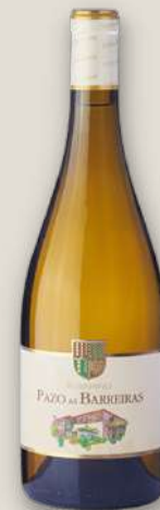
Albariño Pazo as Barreiras