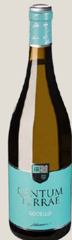
Centum Terrae Mencía