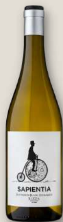
Sapiencia Sauvignon Blanc