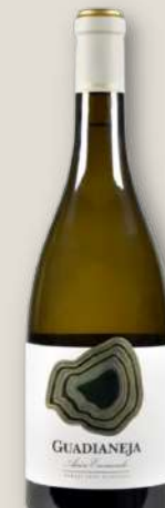
Guadianeja Airén Encascado Alto Hungrao