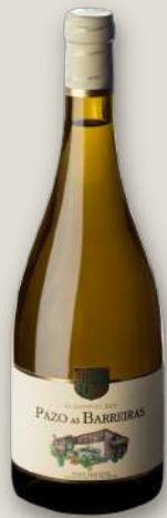
Albariño 2015 Pazo as Barreiras