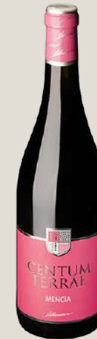
Centum Terrae Mencía